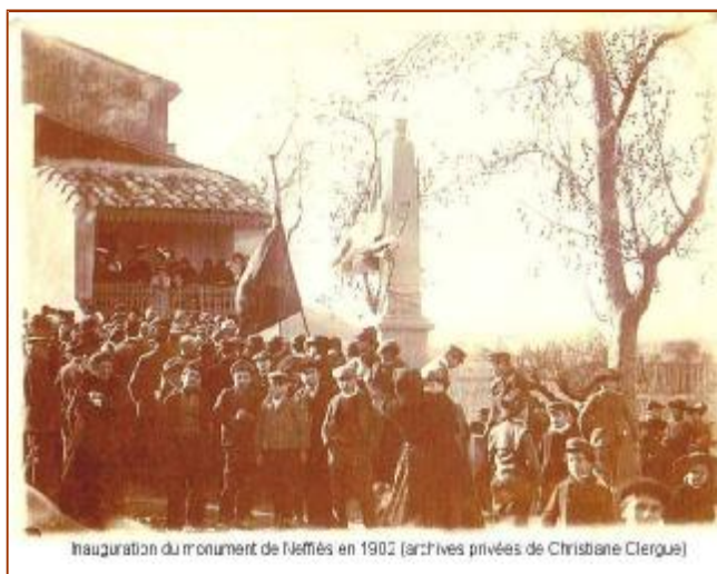
Inauguration du monument de Neffies en 1902