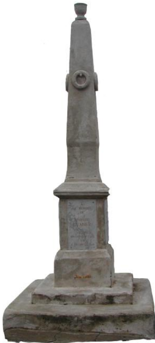
Monument de Neffiès